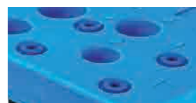
Pines de ensamble