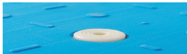
Botón antideslizante / Acabado superficial